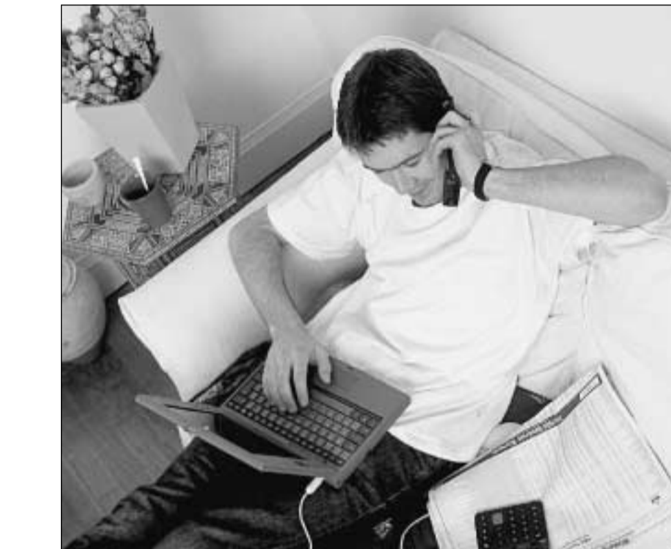
Plus qu'un cadeau, un plan PC Privé constitue aujourd'hui un investissement.